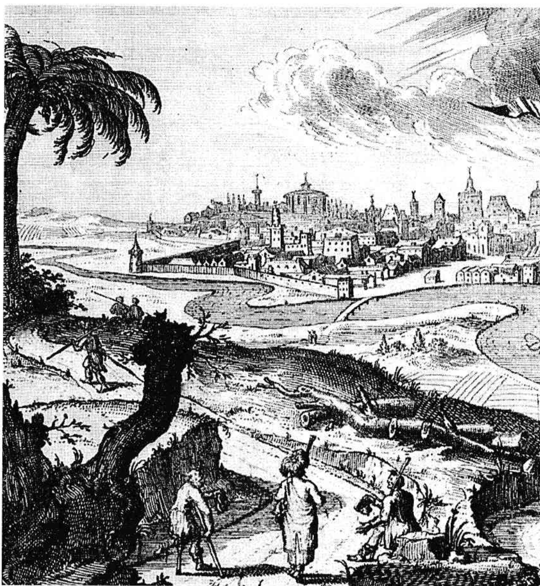
Panoramă a Bucureștiului

PENTRU PERIOADA FEUDALISMULUI TIMPURIU există urme de așezări pe malurile tuturor apelor arealului bucureștean: peste douăzeci și cinci de stațiuni din această perioadă (majoritatea din secolele X-XI), în special pe malul stâng al cursului apelor,