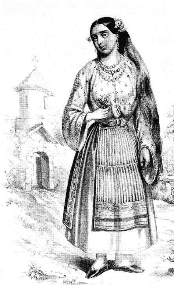
Țărancă din București

PERIOADA REPREZINTĂ maxima înflorire a statului dac și a luptelor dintre daci și romani. Și pentru această perioadă spațiul bucureștean prezintă urme însemnate. La Bălăceanca-Ecluză s-au constatat, în cadrul unor săpături de salvare, două așezări – una din secolele III-II î.e.n. și alta din secolele II-I î.e.n. – în care s-au descoperit zece bordeie, șase locuințe de suprafață și douăzeci și opt de gropi menajere; urme similare s-au găsit la Vlădiceasa (Snagov), din secolele II-I î.e.n., la Tei, Tânganu și, pentru aceeași perioadă, la Bragadiru (treisprezece locuințe, din care un bordei și douăsprezece locuințe de suprafață). Pentru perioada secolelor I-III e.n. au fost găsite urme materiale la Popești-Leordeni, Străulești, Parcul Tineretului, Bragadiru, Ciurel, Pantelimon, Tei, Câmpul Boja-Militari și Cernica. La mănăstirea Mihai-Vodă s-au găsit urmele unei locuiri de lungă durată, începând din sec. II-I î.e.n.: sub biserică și lângă aceasta au fost găsite șase bordeie și trei gropi menajere, fiind interesantă vatra de cult ornamentală descoperită aici; la translaarea bisericii, la pregătirea căii