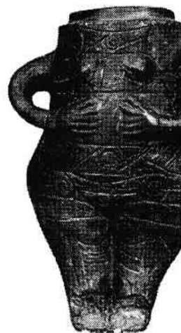
Zeița de la Vidra