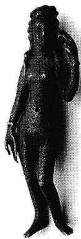
Venus, statuie romană, Lacul Tei, sec. III, bronz

PENTRU A DOUA ETAPĂ A BRONZULUI este caracteristică Cultura Tei (care a cunoscut mai multe faze: Cățelu-Nou, La Stejar, Fundeni, Fundenii-Doamnei), dezvoltată în special în locurile în care anterior a existat Cultura Glina III . Specifice acestor așezări sunt locuințele de suprafață, de mari dimensiuni, sau bordeie de formă ovală (Străulești-Iuncă, Cățelu-Nou). În domeniul olăritului sunt generalizate forme precum ceașca și castronul și o nouă tehnică de ornamentație: incizie punctată și încrustată cu pastă albă, în special elemente sub formă de spirală, figurine umane de lut (Tei, Băneasa, Militari-Câmpul Boja). Urmele descoperite din această perioadă sunt securi de bronz (Cățelu-Nou), seceri de bronz, topor și cuțite, ace, împungătoare, undrele (Tei, Bucureștii-Noi, Fundeni, Chitila-Fermă, Băneasa), vârfuri de săgeți și pumnal – din piatră (Tei). În perioada finală apar influențe ale altor populații și culturi (Gârla-Mare, Verbicioara). Din ultima fază a acestei etape, Fundenii-Doamnei, sunt cunoscute uneltele lucrate din omoplați de vită cu capete crestate și forme noi de vase (Fundenii-Doamnei, Pipera), în special vase cu torți ușor supraînălțate, plecând din buza recipientului, cești cu corp caliciform ș.a.